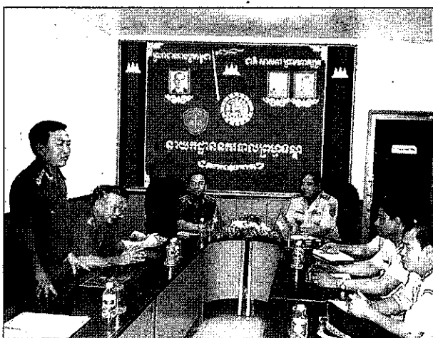
Buổi làm việc giữa đoàn Tổng cục Cảnh sát Việt Nam với đoàn Tổng cục Công an - Bộ Nội vụ Campuchia tại Phnômpenh

* Tổng cục Cảnh sát đang chuẩn bị cho hội nghị chung với Tổng cục Công an - Bộ Nội vụ vương quốc Campuchia về phòng, chống tội phạm, bảo đảm trật tự xã hội sẽ được tổ chức trong thời gian tới tại TPHCM. B.V.N