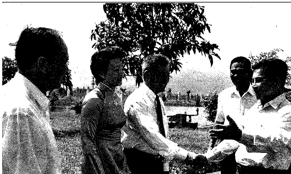
và nói chuyện với nhà đầu tư

TRONG những ngày tháng 7-2009, Chủ tịch nước Nguyễn Minh Triết về thăm tỉnh Trà Vinh, ân cần thăm hỏi và trực tiếp lắng nghe nhiều vấn đề mới về phát triển kinh tế - xã hội, chỉ ra cho tỉnh hướng đi phù hợp nhằm vượt qua thời kỳ khó khăn do ảnh hưởng khủng hoảng kinh tế thế giới. Trà Vinh - một trong những địa phương giàu truyền thống cách mạng và vẫn chưa thực sự thoát khỏi cái nghèo so với một số địa phương khác tại vùng đồng bằng Sông Cửu Long.